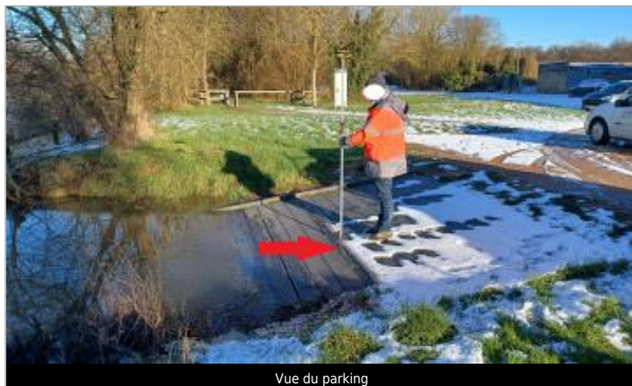
Vue du parking