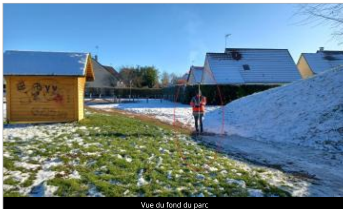
Vue du fond du parc