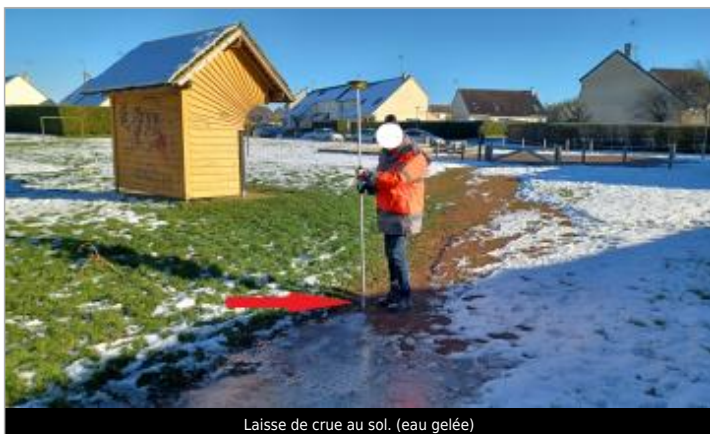
Laisse de crue au sol. (eau gelée)