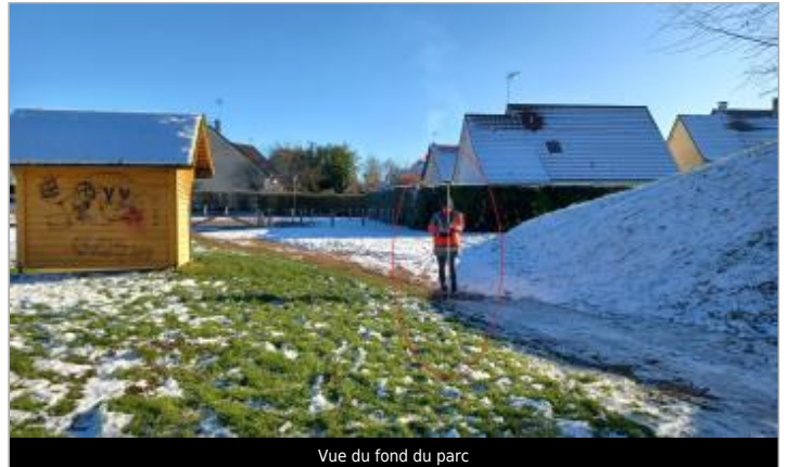
Vue du fond du parc

Coordonnées WGS84 : X: -0.03732650 / Y: 48.73563480