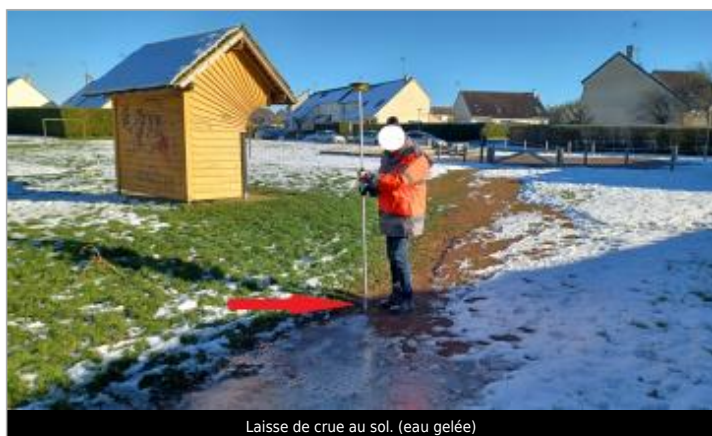
Laisse de crue au sol. (eau gelée)