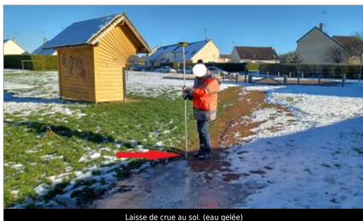
Laisse de crue au sol. (eau gelée)