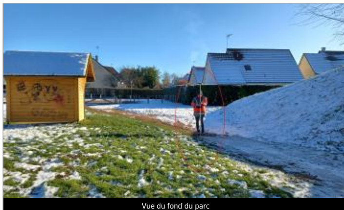
Vue du fond du parc