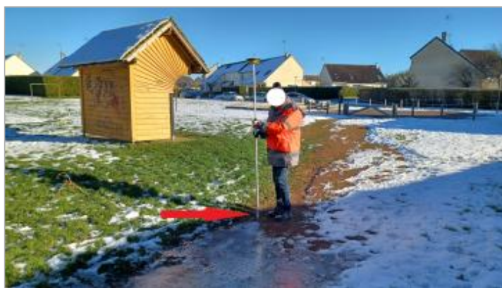
Laisse de crue au sol. (eau gelée)