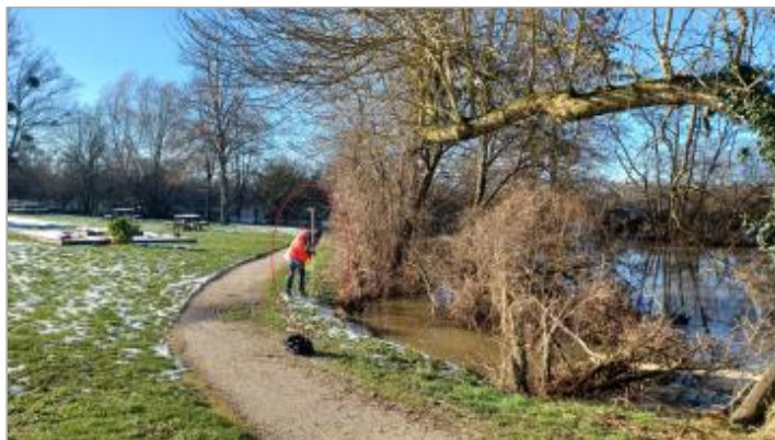
Vue depuis l'extrémité à droite (en faisant face au fleuve) du parc

Coordonnées WGS84 : X: -0.03671437 / Y: 48.73590410