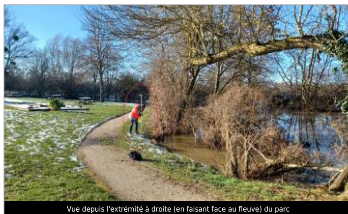
Vue depuis l'extrémité à droite (en faisant face au fleuve) du parc

GÉOLOCALISATION Coordonnées WGS84 : X: -0.03671437 / Y: 48.73590410 Coordonnées RGF93 (Lambert 93) X: 476723.84 / Y: 6852714.1 Coordonnées RGF93 (ETRS89) : X: -0.0367144 / Y: 48.7359041 Code Hydro: I2--0200 Rive de référence: Gauche