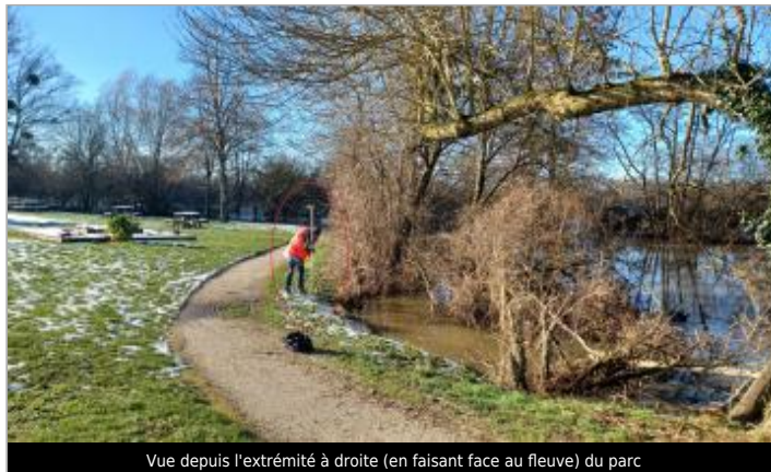
Vue depuis l'extrémité à droite (en faisant face au fleuve) du parc