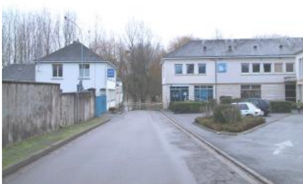
Vue de la photo en janvier 2004

Altitude calculée de l'eau (en m) : 70.465