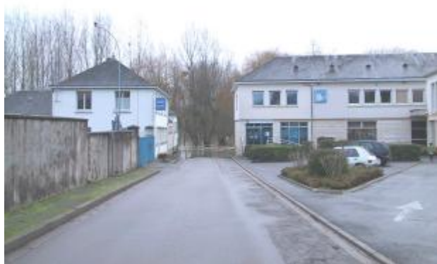
Vue de la photo en janvier 2004

Altitude calculée de l'eau (en m) : 70.463