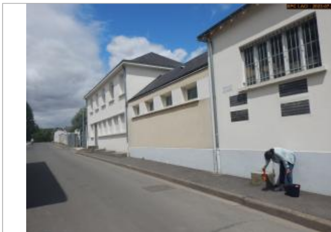
Vue du site en 2023

Coordonnées WGS84 : X: 1.00268110 / Y: 47.12730550