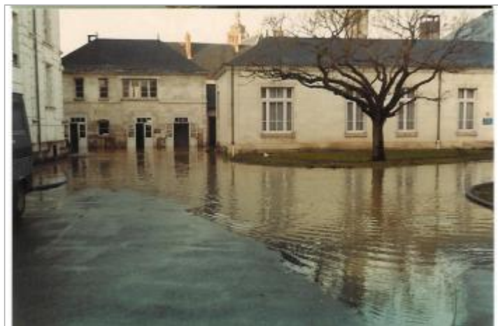
Vue de la photo en décembre 1982

Altitude calculée de l'eau (en m) : 70.674 m