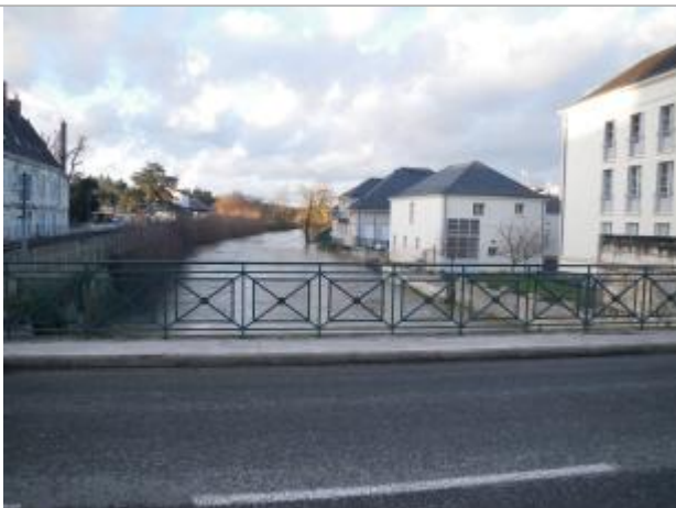
Vue de la photo en février 2013

Altitude calculée de l'eau (en m) : 69.991