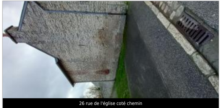
26 rue de l'église coté chemin