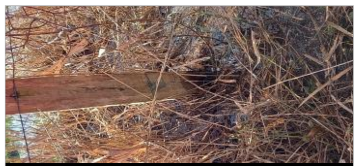
Trace au marqueur, 91.5 cm du haut du poteau

MARQUE Maximum de l'inondation : Oui Visibilité : Oui État du repère : Mauvais Pérennité : Aucune