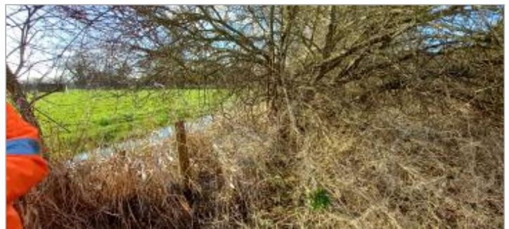
Vue du bosquet

GÉOLOCALISATION Coordonnées WGS84 : X: -0.00917344 / Y: 48.73626830 Coordonnées RGF93 (Lambert 93) X: 478749.36 / Y: 6852677.04 Coordonnées RGF93 (ETRS89) : X: -0.0091734 / Y: 48.7362683 Code Hydro: I21-0400 Rive de référence: Droite