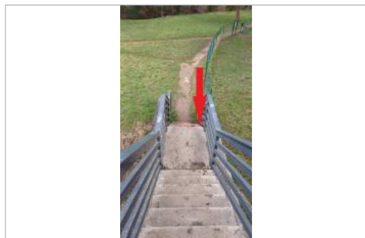
laisse de crue sur la 10 ème marche.

GÉNÉRAL Code : WEB_R_202401230837 Date de mise à jour : 23/12/2024 Auteur : SPC.SACN