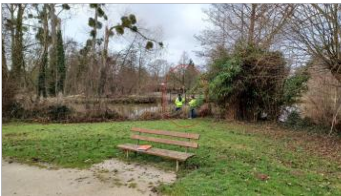
Vue depuis le Kiosque

GÉOLOCALISATION Coordonnées WGS84 : X: -0.02060418 / Y: 48.73982920 Coordonnées RGF93 (Lambert 93) X: 477924.46 / Y: 6853104.75 Coordonnées RGF93 (ETRS89) : X: -0.0206042 / Y: 48.7398292 Code Hydro : I2--0200 Rive de référence : Droite