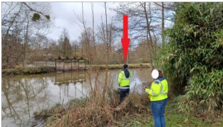
Vue depuis le fond du parc de La Noë

MARQUE Maximum de l'inondation : Oui Visibilité : Oui État du repère : Mauvais Pérennité : Aucune