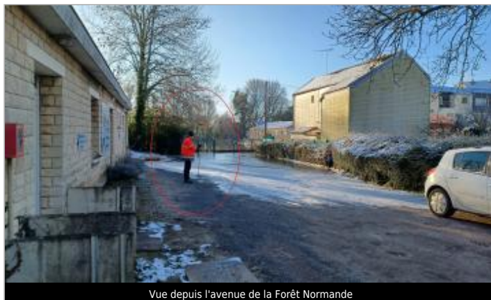
Vue depuis l'avenue de la Forêt Normande