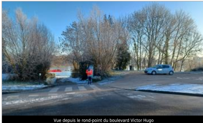
Vue depuis le rond-point du boulevard Victor Hugo