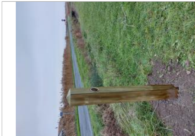
Repère Martin sur poteau en bois

Altitude calculée de l'eau (en m) : 3.94 m