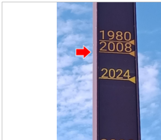
Vue du repère en 2025

Type de repérage : Campagne de terrain post-inondation