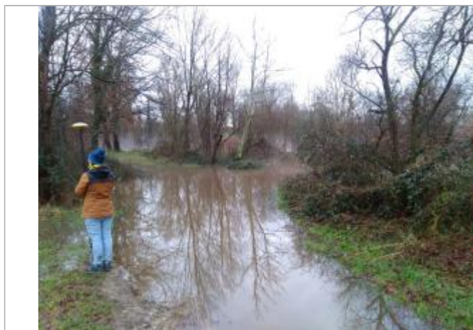
Vue rapprochée de la mesure en 2021

SOURCE DE REPÉRAGE : LIGNES D'EAU, LA DORE, CRUE DU 29 DÉCEMBRE 2021 - 29/12/2021