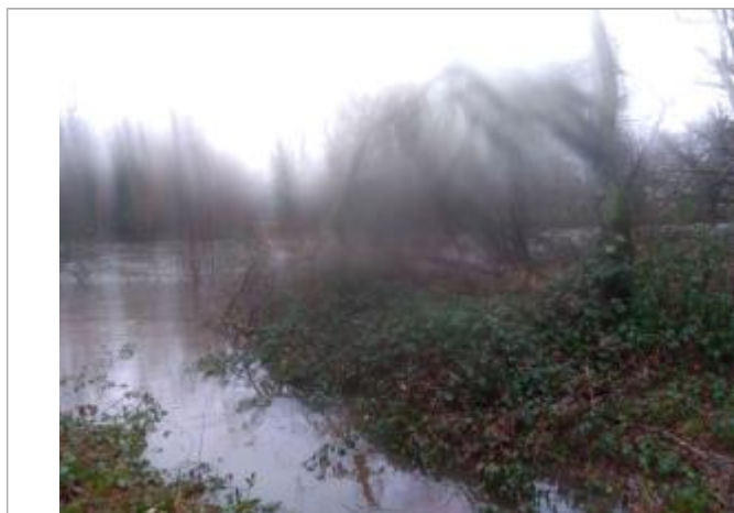
Vue rapprochée de la mesure en 2021