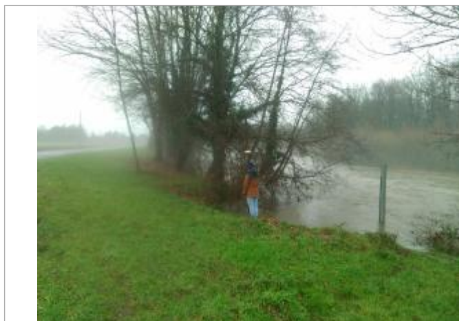
Vue rapprochée de la mesure en 2021