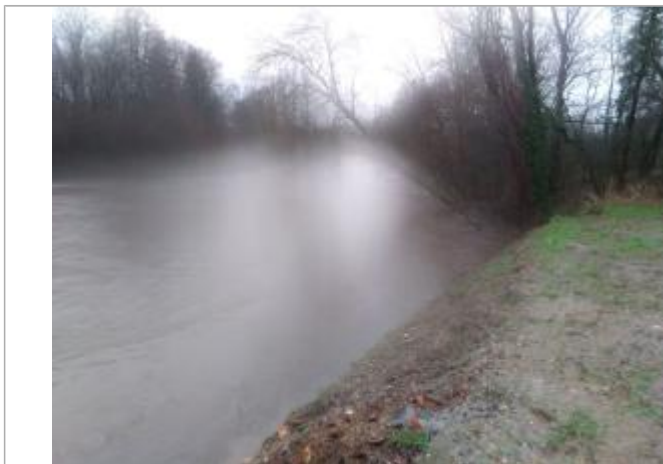
Vue rapprochée de la mesure en 2021

Altitude calculée de l'eau (en m) : 311.63 m