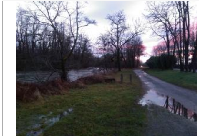
Vue du site en 2021

Coordonnées WGS84 : X: 3.45433452 / Y: 45.95533840