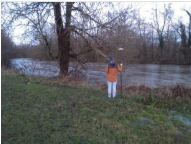
Vue rapprochée de la mesure en 2021

Altitude calculée de l'eau (en m) : 273.892