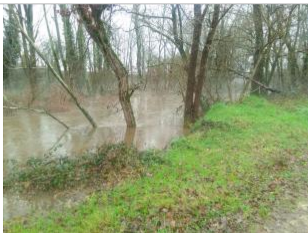
Vue rapprochée de la mesure en 2021