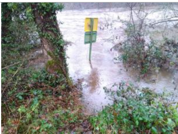
Vue rapprochée de la mesure en 2021

Altitude calculée de l'eau (en m) : 315.538