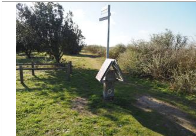
Repère sur le poteau

Altitude calculée de l'eau (en m) : 4.37 m