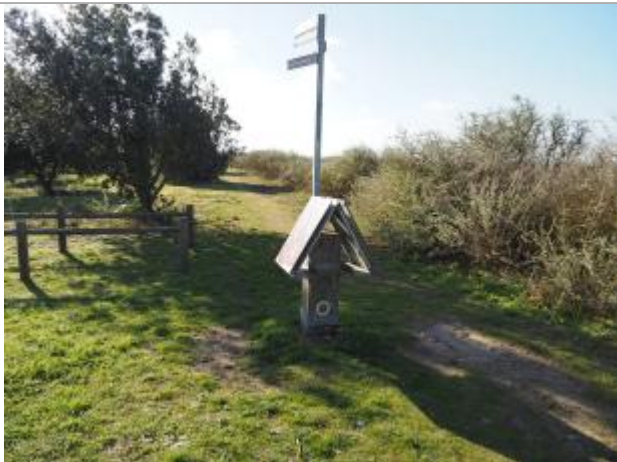
Repère sur le poteau

Altitude calculée de l'eau (en m) : 4.37