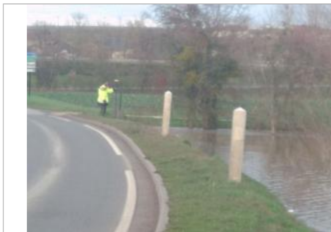
Vue rapprochée de la mesure en 2021