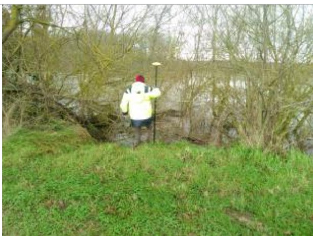
Vue rapprochée de la mesure en 2021