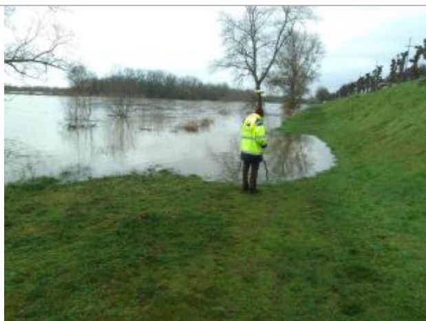
Vue rapprochée de la mesure en 2021