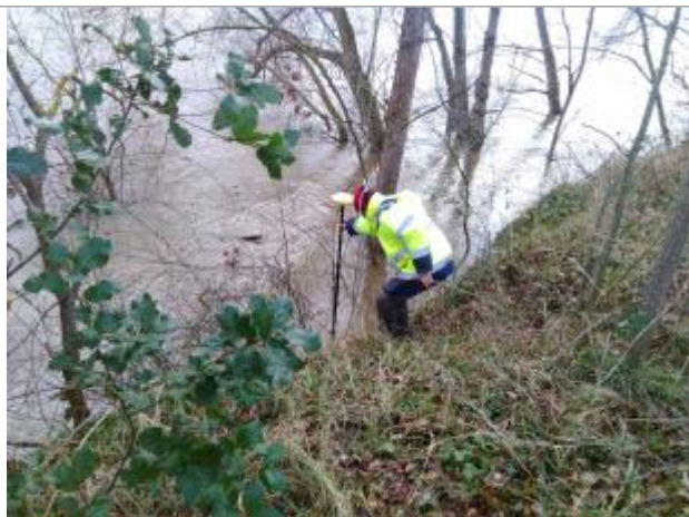
Vue rapprochée de la mesure en 2021