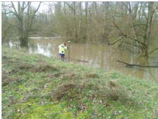
Vue rapprochée de la mesure en 2021