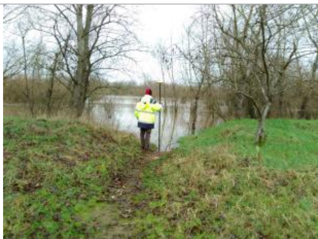
Vue rapprochée de la mesure en 2021