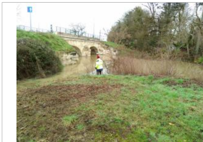
Vue rapprochée de la mesure en 2021