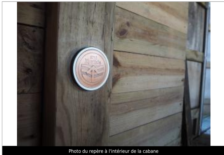
Photo du repère à l'intérieur de la cabane

Altitude calculée de l'eau (en m) : 3.55