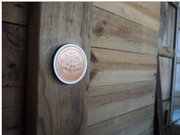
Photo du repère à l'intérieur de la cabane

Altitude calculée de l'eau (en m) : 3.55