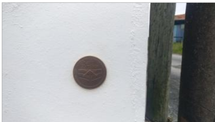
Photo du repère Xynthia

Altitude calculée de l'eau (en m) : 4.58 m