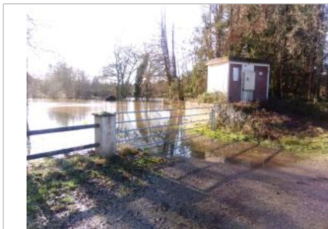
Vue rapprochée de la mesure en 2021