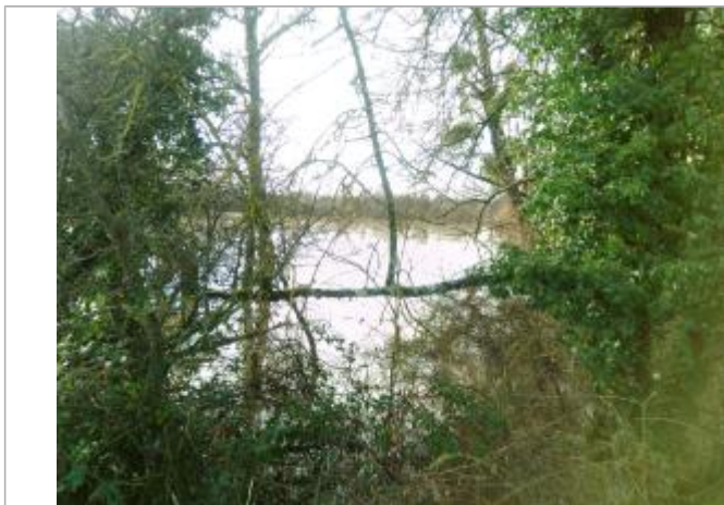
Vue rapprochée de la mesure en 2021