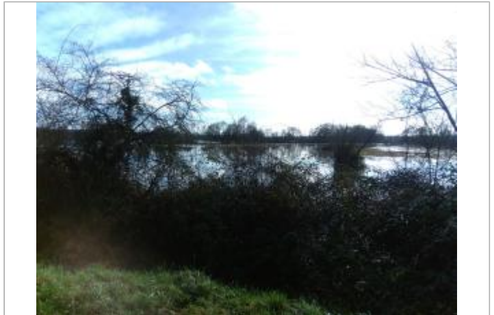
Vue du site en 2021

Coordonnées WGS84 : X: 3.65658653 / Y: 46.86978470