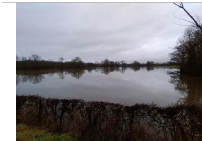
Vue rapprochée de la mesure en 2021