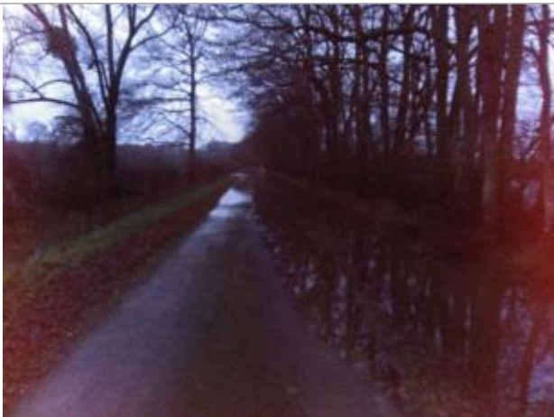
Vue rapprochée de la mesure en 2021

Altitude calculée de l'eau (en m) : 199.499