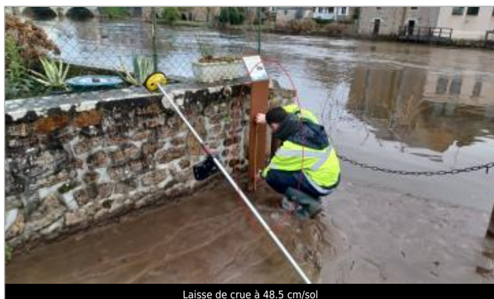
Laisse de crue à 48.5 cm/sol