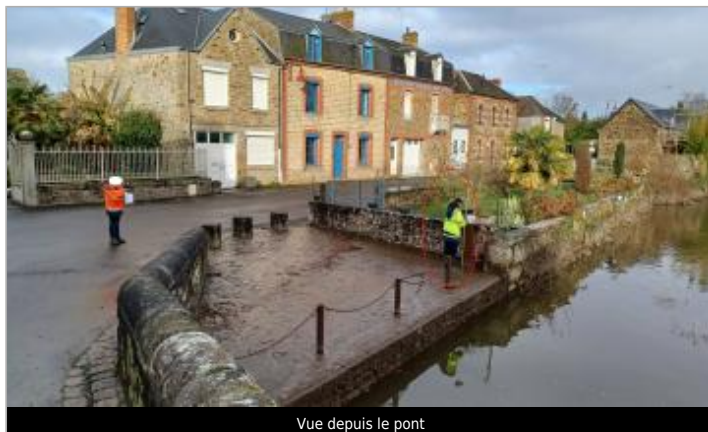
Vue depuis le pont