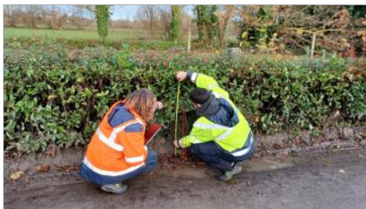
laisse de crue à 62 cm/sol