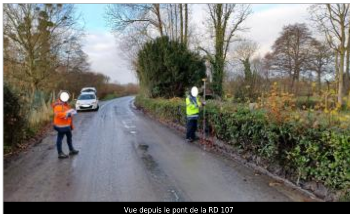
Vue depuis le pont de la RD 107