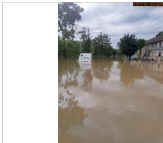
Vue de la photo en 2022

SOURCE DE REPÉRAGE : SPC LACI, CAMPAGNE DE RECENSEMENT 2023 - 12/06/2023