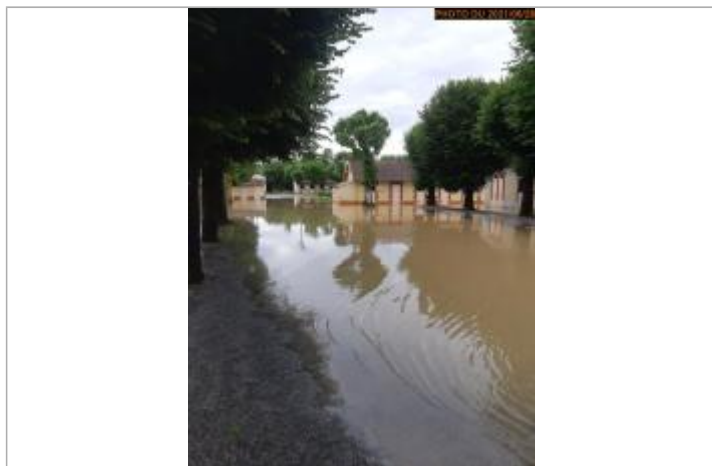
Vue de la photo en 2022