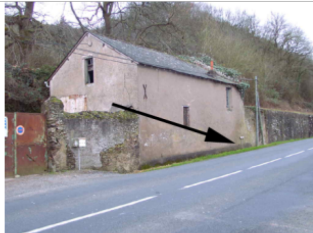
Vue du site BDHE 482 point de repère 782

Coordonnées WGS84 : X: -0.72424460 / Y: 47.34760550