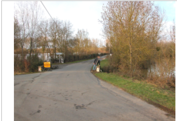
Vue du site BDHE 448 point de repère 693

Coordonnées WGS84 : X: -1.11833510 / Y: 47.35902750