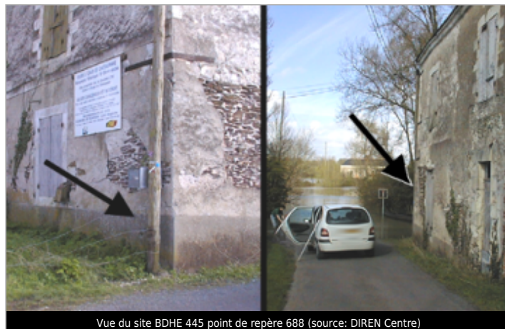
Vue du site BDHE 445 point de repère 688