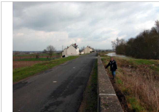
Vue du site BDHE 444 point de repère 790