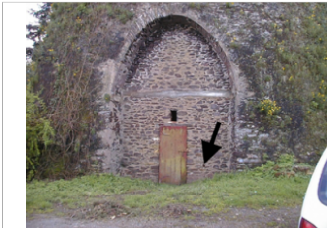
Vue du site BDHE 443 point de repère 686