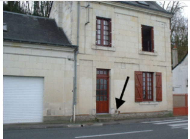
Vue du site BDHE 440 point de repère 683

Coordonnées WGS84 : X: -0.21074790 / Y: 47.33602680