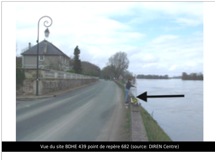
Vue du site BDHE 439 point de repère 682